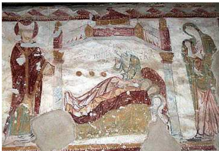
◀ San Nicolás dota a las tres doncellas con tres monedas de oro.

Pintura mural de la iglesia de Saint Jacques des Guérets (Francia), siglo XII.