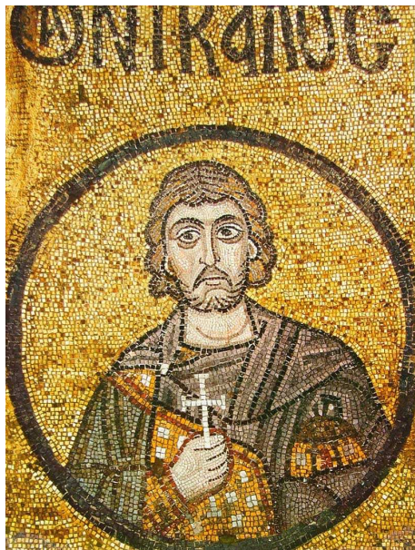
▲ San Nicolás. Mosaico de la basílica de Santa Sofía de Kiev (Ucrania), s. XI.

http://www.icon-art.info/masterpiece.php?lng=en&mst_id=998 [captura 20/11/2011]