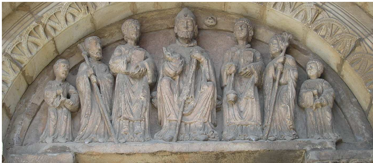
San Nicolás Obispo. Tímpano procedente de la iglesia de San Nicolás de Soria (España), reubicado en la de San Juan de Rabanera, comienzos del s. XIII.