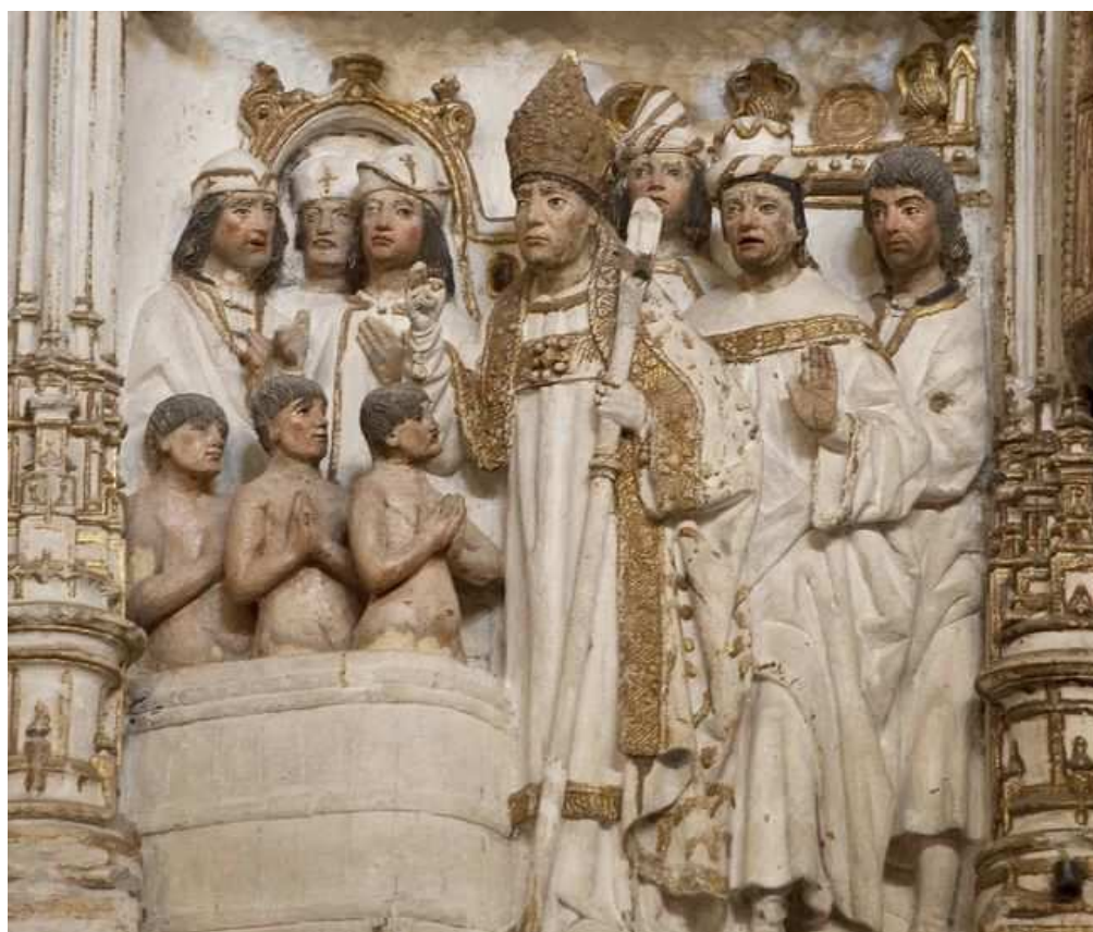
Milagro de los tres niños recuperados de la cuba de sal y resucitados. Francisco de Colonia, Retablo de San Nicolás de Bari de Burgos (España), 1505, alabastro policromado.

http://www.wga.hu/art/a/angelico/06/predel3.jpg [captura 20/11/2011]