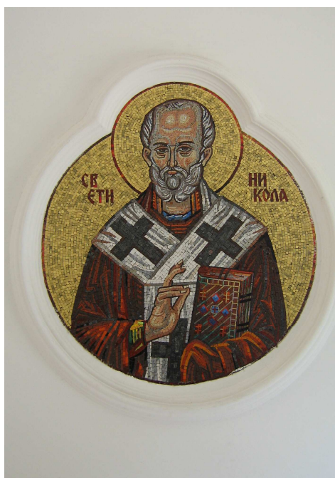
◀ San Nicolás. Mosaico del monasterio serbio de Grgeteg.

http://upload.wikimedia.org/wikipedia/commons/5/5c/Sveti_Nikola.jpg?uselang=es [captura 20/11/2011]