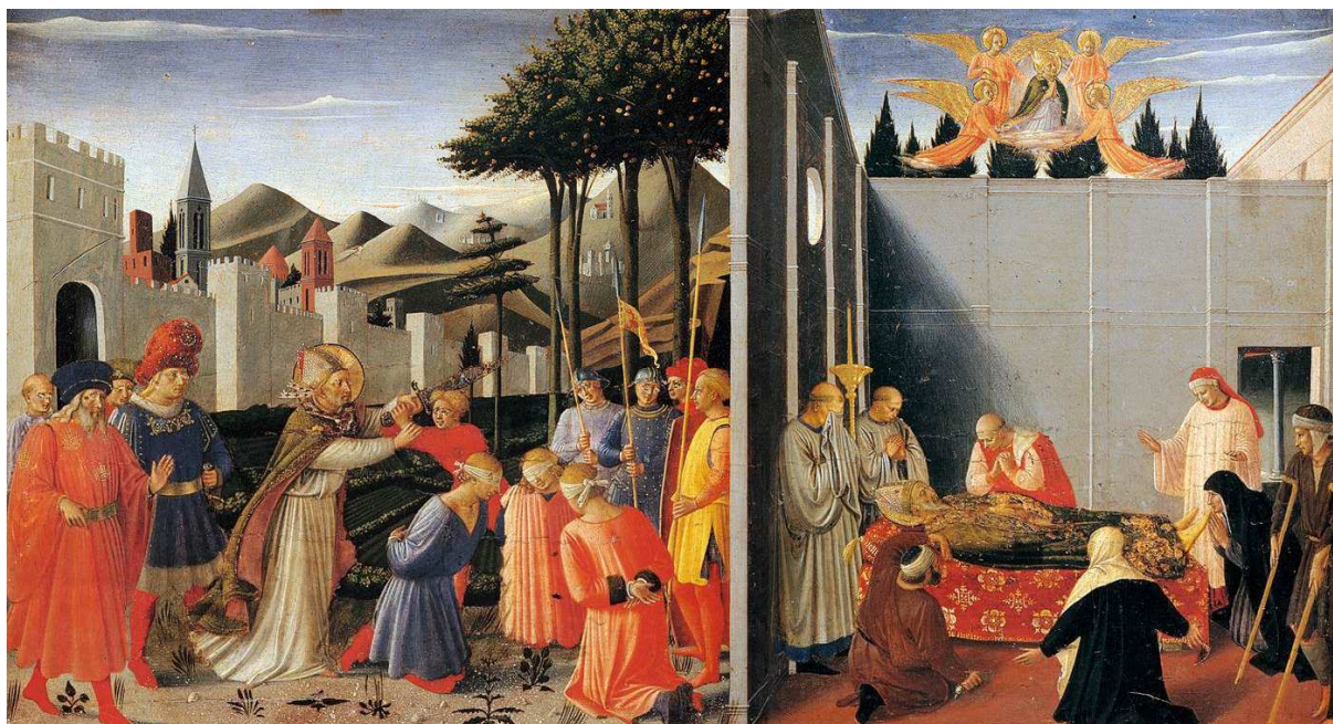
Fra Angelico, San Nicolás liberando a los tres soldados inocentes y Muerte del Santo , predela del retablo de Perugia, ca. 1437. Perugia, Galleria Nazionale dell'Umbria.

http://www.wga.hu/art/a/angelico/06/predel3.jpg [captura 20/11/2011]